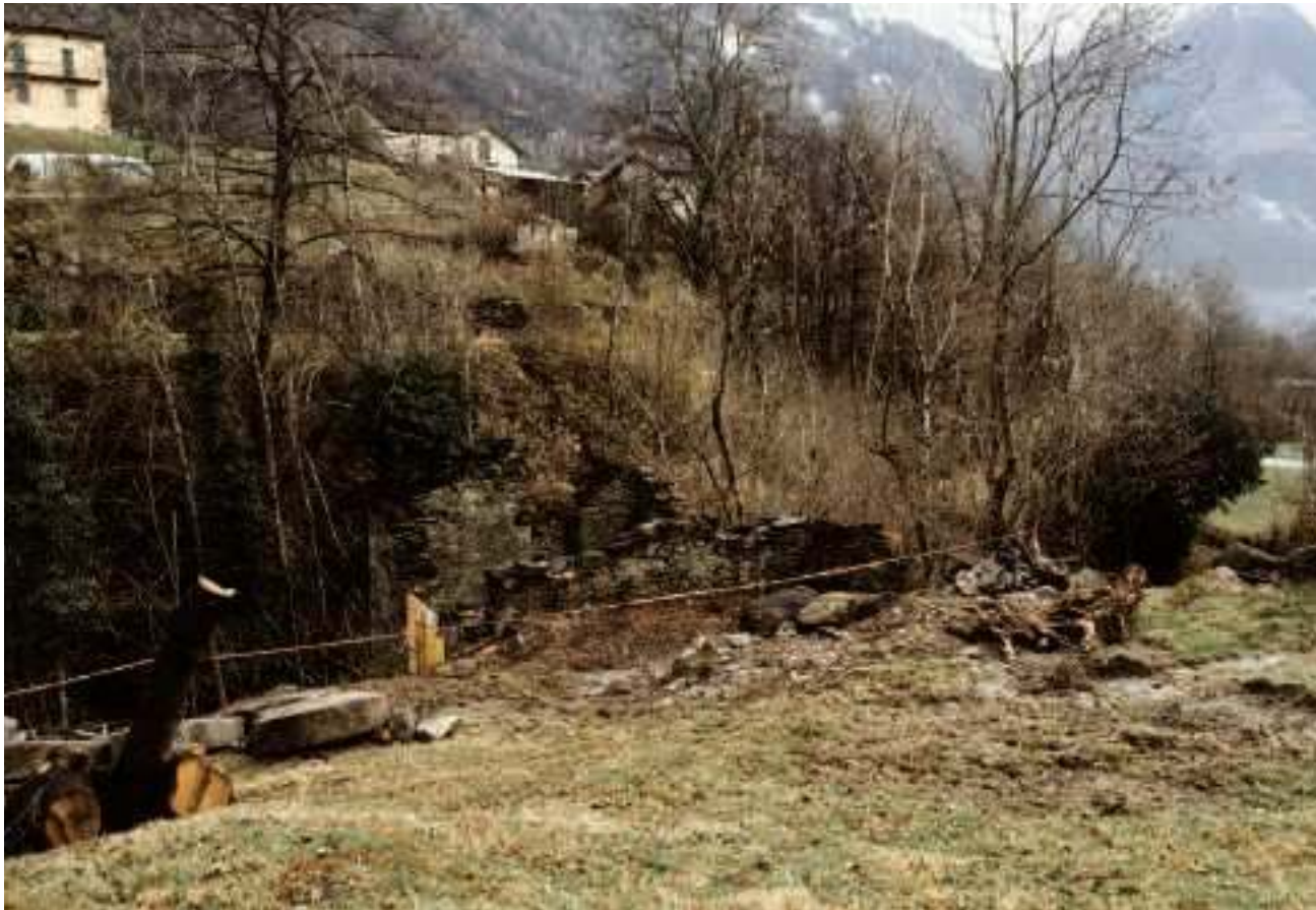
Le mura con le imponenti ruote in sasso scoperte nella frazione di Acquarossa

Sono ai piedi della scala, ben coscienti che prima di realizzare il loro sogno ne potrebbe ancora passare, di acqua. Oro blu che un tempo, almeno un secolo fa, con il suo scorrere fragoroso, muoveva quattro imponenti macine, del diametro di 1,20 metri, che un gruppo di bleniesi, nelle scorse settimane, ha riportato alla luce a Corzoneso Alto. Che il diroccato, che si intravede dagli ultimi tornanti che portano al nucleo, fosse un mulino, era risaputo, quassù. Quello che mancava era però la determinazione di tentare - almeno - di valorizzarlo. Slancio che si è concretizzato di recente, chiamando a raccolta una ventina di persone, tra cui diversi giovani. Armati di attrezzi, in una giornata di lavoro in compagnia, hanno liberato lo stabile diroccato dalla vegetazione e dal materiale depositato che minacciava di cancellarlo, per sempre, dalla memoria. Incontrandoli, settimana scorsa nella frazione di Acquarossa, ci ripetono «di essere agli inizi». Intanto però - facciamo loro notare - un primo risultato, tangibile, c'è. Lo dimostrano le quattro mura in sasso che svettano aldilà del Riale di Corzoneso, i pavimenti in piode dello stabile con il focolare in un angolo: finalmente ripuliti. E le quattro macine estratte, probabilmente impiegate per la produzione di farina di segale.